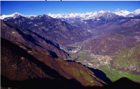
Panorama della Bassa Valle verso NW. Le grandi strutture attraversano il solco senza discontinuità rilevanti. Dal borgo di Verrès (conoide dell’Evançon) in su la valle attraversa la falda oceanica piemontese (zona Zermatt-Saas) fino alla base del Cervino (in alto a destra).

Altri interessi: Ricca documentazione dell’architettura rurale alpina (ponti in pietra, mulini, edifici sacri, varie tipologie di case e edifici rurali dal XVI sec. in poi) e dell’urbanistica tradizionale (“comunitaria”) dei villaggi valdostani.