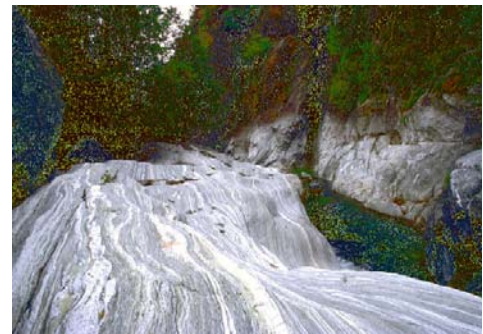
Successione di piani di stiramento in giacitura verticale su roccia a quarzo + giadeite o epidoto. La struttura guida l’erosione, torrenti e valloni s’impongono sulla direzione della deformazione.

Inoltrarsi a piedi nel villaggio di Courtil; alla sua sommità NW prendere in salita un sentiero segnalato fiancheggiato da un muretto. Se dopo un centinaio di metri diviene impraticabile, deviare sul sentiero a destra per risalire sulla stradina asfaltata, vietata alle auto. Altrimenti proseguire dritto giungendo per sentiero agli alpeggi alla base del colle e lì prendere la pista carrozzabile. Deviare un poco a sinistra verso la cava di lose per prendere qualche bel campione di giadeite. Al colle, irto di antenne, risalire il crinale verso destra (est) per trovare ben presto un sentierino che porta alla cima pianeggiante. Nel panorama notare la palestra di roccia di Machaby tracciata sul versante opposto in proseguimento del nostro fascio eclogitico. Ridiscesi verso Courtil, portarsi a destra (ovest) accanto ad una fontana e scendere lungo il sentiero una cinquantina di metri sotto il villaggio. Qui una vasta superficie di roccia chiara e bagnata da un torrentello è attraversata dal dicco lamprofirico (salire due passi per vedere meglio). Risalire al villaggio e al parcheggio, scendere a Pontboset.