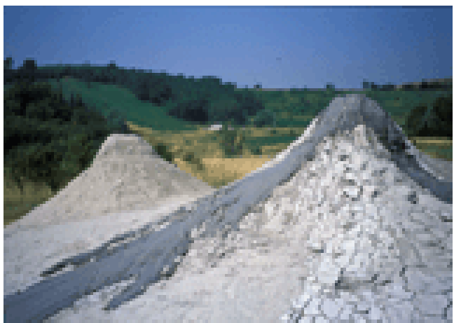
Fig. 6 – Le “Salse di Nirano”, nel basso Appennino modenese

I corsi d'acqua che attraversano la fascia marginale dell' Appennino, prima di immettersi nella pianura, presentano un tipico letto a rete di canali convergenti, divergenti, intrecciati fra loro e separati da isole e barre. Questa morfologia fluviale ha un percorso facilmente variabile, in