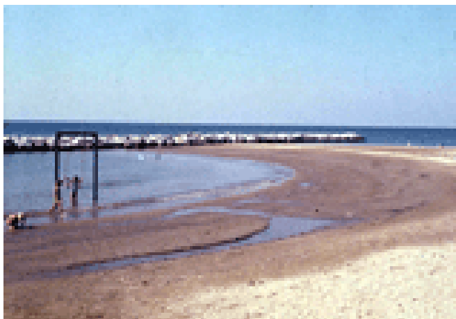
Fig. 10 – Tratto di costa romagnola in erosione, presso Rimini, difesa da scogliere frangiflutto. Queste, limitando il moto ondoso presso il litorale, possono impedire l'evacuazione verso il largo di sostanze inquinanti, con grave rischio per i bagnanti

L'asportazione di materiale dagli alvei, in particolare, può provocare una serie di molteplici conseguenze a breve e a lungo termine. Fra queste, presso le foci fluviali ed i litorali limitrofi si può verificare un minor apporto di detrito grossolano, con conseguente diminuzione del rifornimento di materiale alle spiagge, con il risultato quindi di un loro arretramento. Per ostacolare questo fenomeno, di fronte a molti tratti della costa romagnola sono state costruite delle barriere frangiflutto: queste, soprattutto attraverso il processo della rifrazione delle onde, hanno la funzione di favorire un ripascimento del materiale lungo le spiagge; a volte però, limitando il moto ondoso presso il litorale, possono ostacolare l'evacuazione verso il largo di sostanze chimiche e organiche inquinanti (fig. 10).