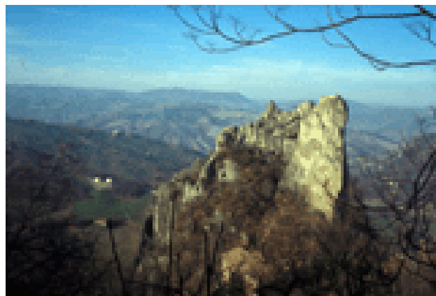
Fig. 3 – I Sassi di Rocca Malatina, esempio di morfoselezione (medio Appennino modenese)

La zona di alta montagna si rastrema verso l'Appennino romagnolo e confina verso settentrione con una fascia di media montagna, corrispondente più o meno all'area di affioramento delle cosiddette "Argille scagliose". Con questo termine, scientificamente in disuso, ma consolidato nell'uso corrente, viene indicato un insieme di formazioni eterogenee e caotiche, a prevalente componente argillosa; a queste si frappongono o sovrappongono formazioni rocciose generalmente più compatte: blocchi arenaceo-marnosi, placche calcareo-arenacee, frammenti di rocce eruttive ecc. La morfologia selettiva che ne deriva è in prevalenza costituita da groppe arrotondate e monotone e da versanti a modesta acclività, interrotti da piastroni massicci e isolati da ripide pareti, come la Pietra di Bismantova (nel Reggiano), oppure da spuntoni o scogli rocciosi, come il Monte Nero (nel Parmense) o il Sasso Tignoso (nel Modenese), oppure da guglie affilate, come i Sassi di Rocca Malatina (nel Modenese) (fig. 3).