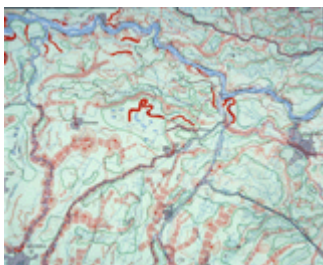
Fig. 8 – Stralcio della “Carta geomorfologica della pianura padana” (MURST, 1977), fra Ferrara e Modena: sono evidenziati, i paleoalvei, le aree depresse (“valli”) e le brecce di rotta negli argini

evoluzione geomorfologica recente del territorio pianiziale e costiero della regione emiliano-romagnola (fig. 8).