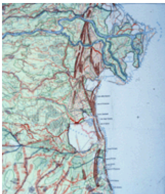
Fig. 9 - Stralcio della “Carta geomorfologica della pianura padana” (MURST, 1977), fra il Delta del Po e Ravenna: sono evidenziati gli antichi cordoni litoranei e i paleodelta

Le forme relitte riconosciute e studiate sono soprattutto paleoalvei, paleo “valli”, paleodune e paleodelta. I primi si riferiscono a letti o argini fluviali non più attivi, individuabili, ove non corrispondenti a dei dossi, attraverso variazioni morfologiche o cromatiche del terreno. Le seconde rappresentano aree depresse collegabili ad antiche conche di decantazione di piene o ad aree golenali. Le paleodune raffigurano antichi cordoni litorali, costruiti dal vento a ridosso di paleospiagge: testimoniano perciò