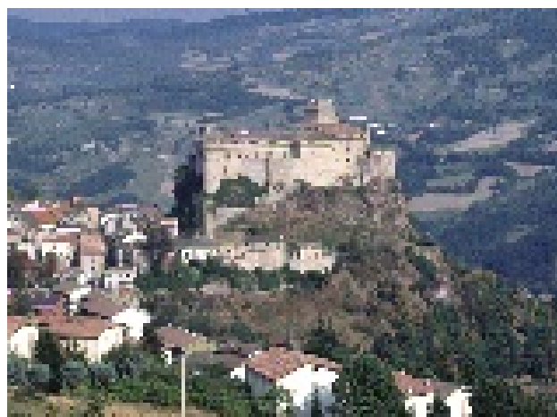
Fig. 4 – Il castello di Bardi, arroccato su uno spuntone ofiolitico (Appennino parmense)

Sulla sommità di alcune di queste groppe rocciose sono stati edificati alcuni castelli medioevali, come quello di Bardi (in provincia di Parma) (fig. 4) o quello di Rossena (in provincia di Reggio Emilia).