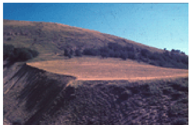
Fig. 2 – I depositi “periglaciali” del M. Prampa, che testimoniano un ambiente morfoclimatico più rigido di quello attuale (App. reggiano).

Altre forme d'alta montagna in parte relitte e in parte attive sono le falde di detrito, che si formano ai piedi delle pareti rocciose, per l' accumulo di detriti provenienti da processi di frantumazione della roccia ad opera di azioni di gelo-disgelo. Una tipica forma relitta di un accumulo di detriti da gelifrazione, messi in posto da processi di ruscellamento nivale, è ben visibile sul versante meridionale del monte Prampa, nell' Appennino reggiano, preservata dai successivi fenomeni di erosione grazie a una favorevole situazione geomorfologica (fig. 2).