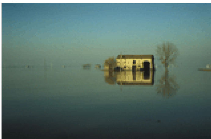
Fig. 11 – Tratto di pianura padana sommerso dall'alluvione del Panaro del 10 dicembre 1982, a ovest di Finale Emilia

- inoltre quella degli autori ivi citati.